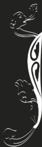
Imagem: Apocalipse do Larvão. Finales del siglo IV (Lisboa, PT, Mosteiro Santa Maria do Larvão)

FCT Fundação para a Ciência e a Tecnologia